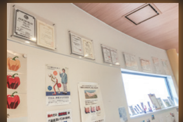
受付ホールにはレースの賞状やトロフィーがずらり